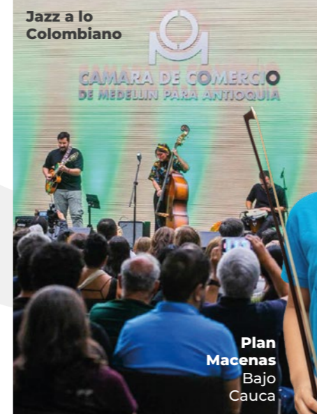
Plan Macenas Bajo Cauca

54.869 personas beneficiadas con 304 actividades culturales. 42 % en regiones. 20.559 mujeres accedieron a servicios de la Cámara. 1.660 participaron en programas dirigidos.