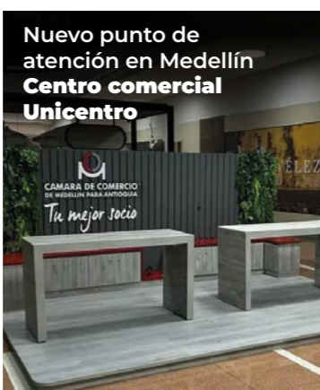
Nuevo punto de atención en Medellín Centro comercial Unicentro