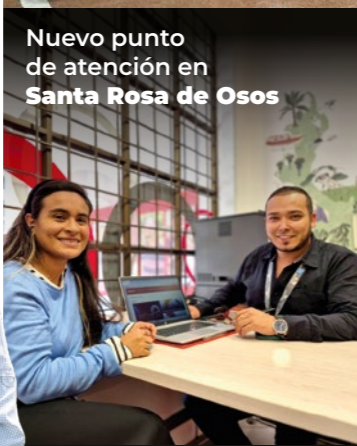
Nuevo punto de atención en Santa Rosa de Osos