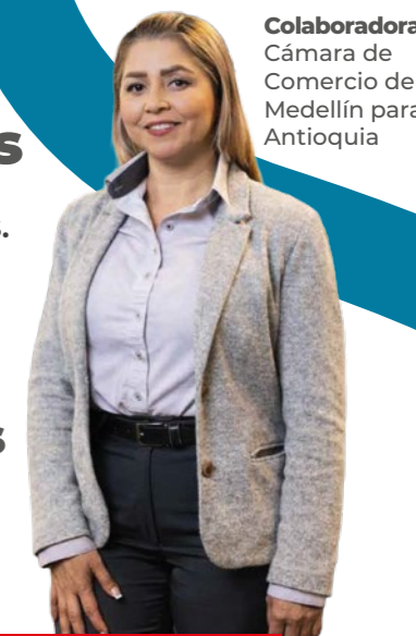
Colaboradora Cámara de Comercio de Medellín para Antioquia

Beneficiadas con los programas y servicios empresariales. 566 Colaboradores Trabajando para los empresarios todos los días.