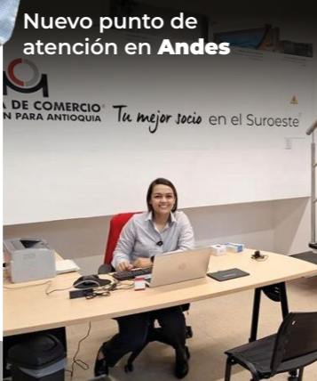
Nuevo punto de atención en Andes

El Norte, Occidente, Suroeste, Bajo Cauca, Aburrá Norte y Medellín, tienen su Cámara de Comercio